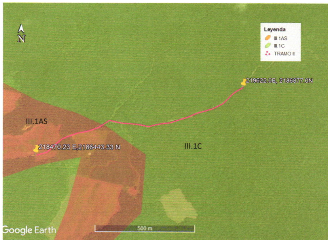
Figura 2.-El sitio propuesto del proyecto del tramo II se ubica en la unidad de gestión ambiental III.1AS Y III.1C en base al Programa de Ordenamiento Ecológico Local del Municipio de Hopelchén.

En base a las coordenadas UTM del tramo II, inicio: 218470.23E, 2186443.33N; Termino 219622.0E, 2186877.0N, se determina que el proyecto se ubica en la Unidad de Gestión Ambiental III.1AS Y III.1C, en base al Programa de Ordenamiento Ecológico Local del Municipio de Hopelchén, como a continuación se señala: