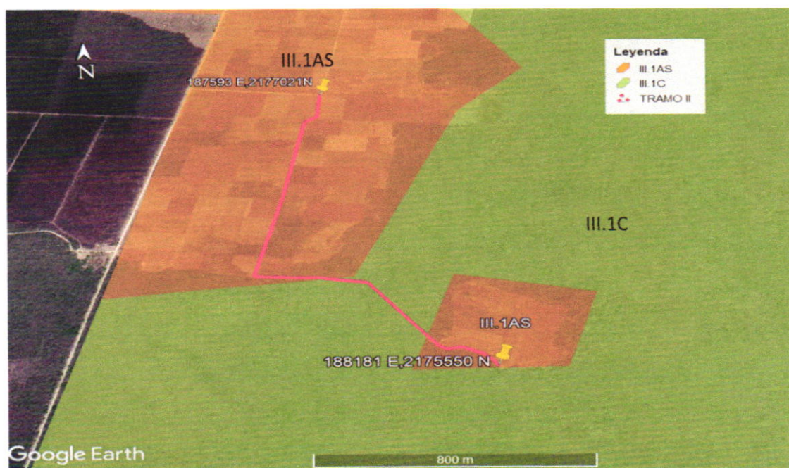
Figura 2.-El sitio propuesto del proyecto del tramo II se ubica en la unidad de gestión ambiental III.1AS Y III.1C en base al Programa de Ordenamiento Ecológico Local del Municipio de Hopelchén.

Segundo: En base a las coordenadas del proyecto cuya pretendida ubicación en Crucero San Luis, cuyas coordenadas UTM del tramo II, inicio: 187593E, 2177021N; Termino 188181E, 2175550N, se determina que el proyecto se ubica en la Unidad de Gestión Ambiental III.1AS Y III.1C, en base al Programa de Ordenamiento Ecológico Local del Municipio de Hopelchén, como a continuación se señala: